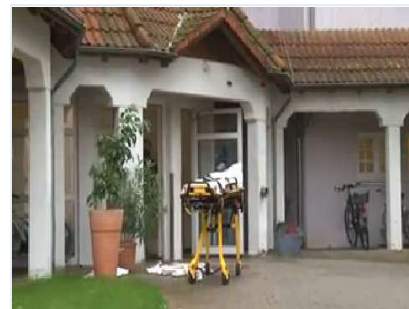
Sandhausen: Tote bei Brand in Pflegeheim